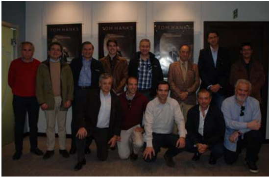
40 colegiados asistieron en exclusiva a un pase especial previo al estreno de la película Sully