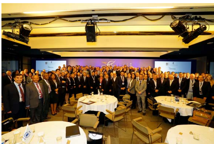
COPAC participó activamente en el VIII Global Humanitarian Aviation Conference del Programa Mundial de Alimentos de Naciones Unidas que se celebró en Madrid en el mes de octubre

Se estrechó la relación con MAPAMA , en concreto con el Área de Defensa contra Incendios Forestales, en relación a los contratos públicos de los servicios de lucha contra incendios y la labor de las Comunidades Autónomas.