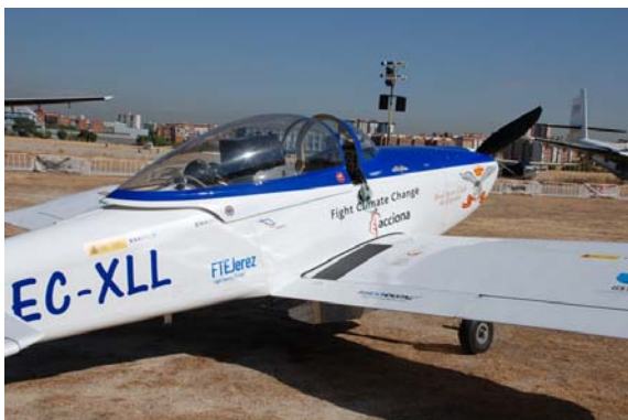
Miembros del COPAC asistieron al despegue de la aeronave RV-8 del aeródromo de Cuatro Vientos, dando comienzo a la segunda fase del proyecto Sky Polaris