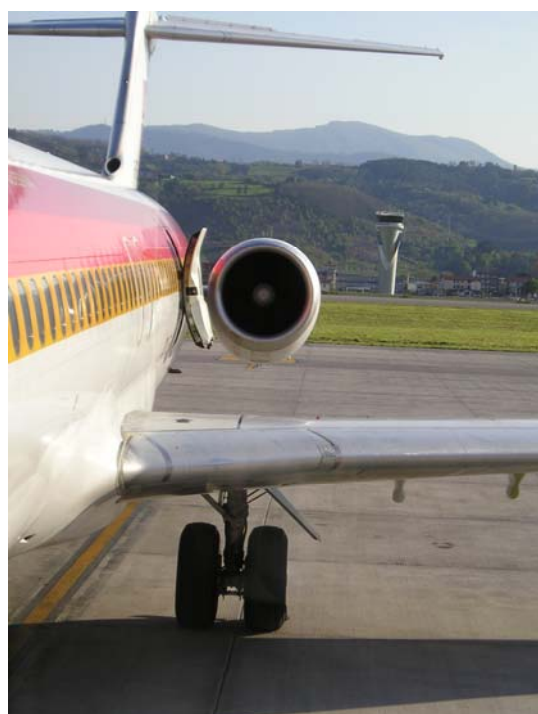
Aeropuerto de Bilbao

En 2016, tras la situación que se vivió en el TMA de Madrid el 29 de abril con motivo de una fuerte tormenta se celebró una Ceanita extraordinaria y monográfica de dichos acontecimientos. El COPAC participó en la reunión y presentó alegaciones al informe, incidiendo en la necesidad de que EnAire implemente herramientas para que los controladores de tránsito aéreo dispongan de información meteorológica precisa y actualizada, desarrolle una formación y entrenamiento específico sobre fenómenos tormentosos y su afección al tráfico aéreo y establezca procedimientos adecuados para la gestión de amenazas y errores. Así mismo, el COPAC incluyó en sus alegaciones la necesidad de que los operadores establezcan protocolos específicos para la asignación de alternativos y carga de combustible cuando se prevean fenómenos tormentosos.