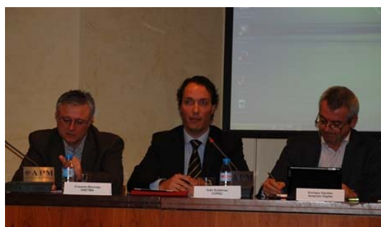
COPAC participó junto a otras organizaciones en la V Mesa redonda sobre el Estado de la Aviación organizada por Aviación Digital.

12 de diciembre. COPAC participó en la V Mesa redonda sobre el Estado de la Aviación organizada por Aviación Digital, que repasó los aspectos más destacados del sector a lo largo de 2014. La mesa de debate contó con representantes de distintas organizaciones del sector aéreo.