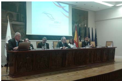
El Decano participó en el Congreso de Ingeniería Aeronáutica organizado por el COIAE

Jornada sobre Formación y Especialización de pilotos 27 de noviembre. COPAC celebró una Jornada sobre Formación y Especialización de pilotos para analizar el sistema de formación y su adaptación a las necesidades reales de los distintos sectores de la aviación comercial. Contó con la participación de operadores, FTO's, centros de entrenamiento y la autoridad aeronáutica y puso de manifiesto la necesidad de conectar la formación básica con las necesidades de los operadores, siempre partiendo de estándares de calidad y excelencia. El COPAC también presentó su visión sobre la formación de pilotos en la aviación comercial, destacando el reconocimiento profesional que deben tener los instructores.