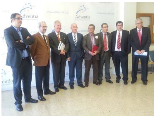
COPAC asistió al Pilot Innovation Day organizado por Adventia, una jornada sobre innovación en la cabina de vuelo y a la demostración de la aplicación de las Google Glass al vuelo