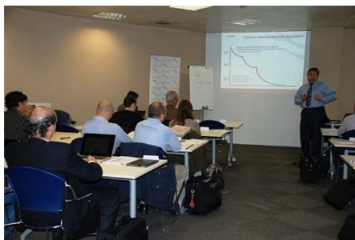
COPAC organizó en el mes de abril una jornada de trabajo sobre Sistemas de Gestión de la Seguridad (SMS)