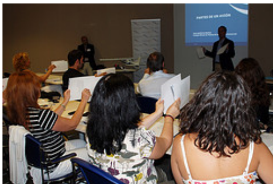
Curso de formación a periodistas sobre la profesión de piloto al que asistieron alrededor de veinte informadores

20 de agosto. El decano y el director general técnico del COPAC asisten en Madrid a los actos conmemorativos del cuarto aniversario del accidente del JK5022.