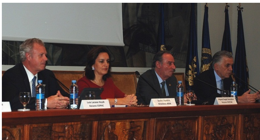
El COPAC coordinó la celebración de la Jornada de Análisis para la Mejora de la Seguridad en compañías aéreas

En 2012 el COPAC mantuvo diversos contactos con otras organizaciones profesionales del sector aéreo, como APROCTA para la búsqueda de sinergias y colaboración en materia de seguridad de las operaciones aéreas. Así mismo, el COPAC impulsó la celebración de una jornada de análisis junto al Colegio Oficial de Ingenieros Aeronáuticos (COIAE), el Colegio Oficial de Ingenieros Técnicos Aeronáuticos (COITAE) y la Asociación Sindical Española de Técnicos de Mantenimiento Aeronáutico (ASETMA) con el objetivo de analizar conjuntamente la situación de la seguridad en compañías aéreas y los márgenes de mejora.