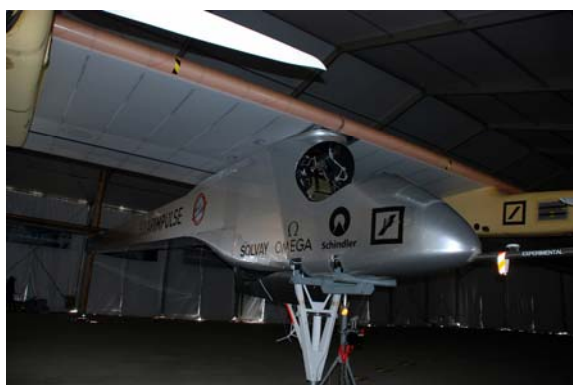
El Decano junto a varios colegiados visitaron el primer avión impulsado por energía solar a su paso por España