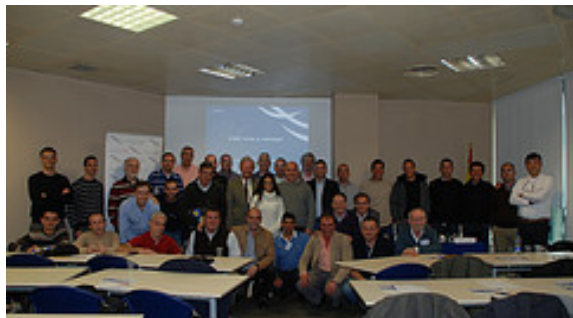
Las Jornadas Técnicas de Helicópteros: Factores Operacionales, contaron con numerosos expertos