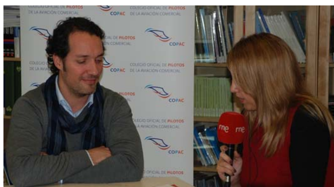
El Director General Técnico atiende a un medio de comunicación

Precisamente, con el objetivo de dar a conocer el ejercicio profesional de los pilotos y su responsabilidad, resolver dudas y malentendidos y aclarar tópicos y estereotipos entre los periodistas, el COPAC organizó un curso dirigido específicamente a periodistas. A lo largo de una mañana la veintena de participantes pudieron conocer aspectos básicos sobre las aeronaves, el vuelo y las funciones de los pilotos además de asistir a una sesión de simulador en la que comprobar de primera mano algunas de las cuestiones teóricas vistas durante el curso. La iniciativa, inédita, tuvo muy buena acogida entre los periodistas, que valoraron positivamente la utilidad de los conocimientos adquiridos para el desempeño de su actividad profesional.