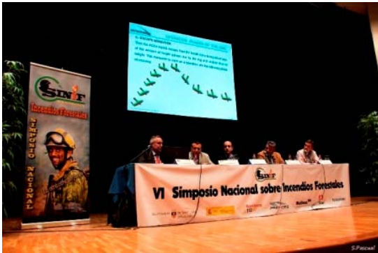
COPAC participó en el VI Simposio Nacional sobre Incendios Forestales (SINIF).