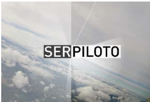
En octubre se presentó Ser Piloto, el documental del COPAC sobre la profesión