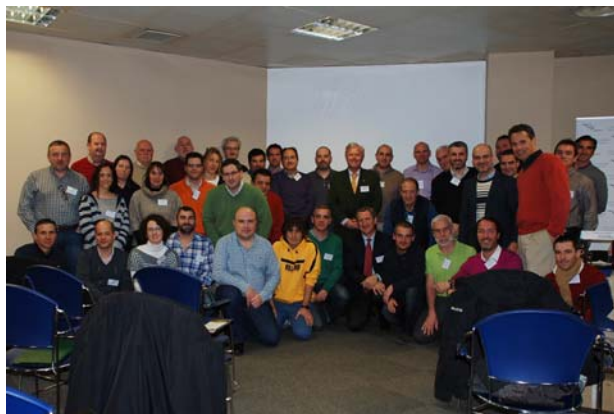
Foto de los asistentes a las IV Jornadas de Helicóptero sobre actividades de lucha contra incendios.

17 y 18 de marzo. COPAC celebra las IV Jornadas Técnicas de Helicópteros sobre actividades aéreas de lucha contra incendios con la participación de pilotos de diferentes operadores así como representantes de AESA, del 43 Grupo de Fuerzas Armadas y del MAGRAMA. La seguridad de las operaciones fue el eje central de las jornadas, que contaron con 40 asistentes.